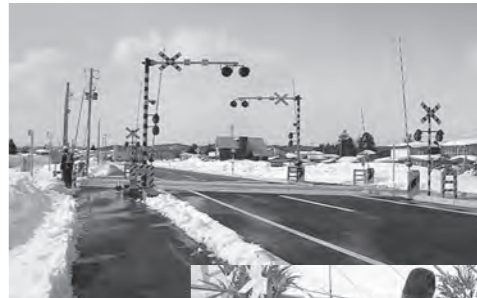
▲西向きから見た中小松バイパス

2月20日に高畠川西線の中小松バイパスが開通するにあたり、同日正午、安全祈願祭と開通式が行われました。平成15年着工から、12年の整備運動を経て開通となった中小松バイパス。大型車の行き来がスムーズになり、町の観光の目玉である川西ダリヤ園のアクセスもしやすくなるなど期待が高まります。これに伴い、バイパス北側の中小松踏切が車両通行止めとなり、自転車・歩行者のみの通行となりました。交通安全に注意したうえご利用ください。