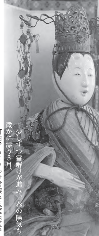
少しずつ雪解けが進み、春の陽気も微かに漂う3月。

～第16回玉庭ひなめぐり～ 期日：3月29日(土)・30日(日) 受付時間：午前9時～午後2時 受付場所：玉庭地区交流センター四方山館、土礼味庵 鑑賞時間：両日とも受付後午後3時30分まで 協力費：一般1,500円 小中学生500円 前売券1,200円 発売中 玉庭地区交流センター四方山館 ☎48-2130 ※横山家では3月28日(金)までひな飾りを一般公開しています。(火曜定休) 詳細は上記まで。