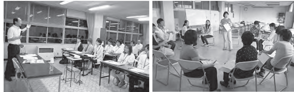
▲マイスター養成講座の風景

地域づくり活動や地区経営母体の運営などに必要なスキルを身に付けた次代を担う人材です。 本町では、地域を支える「まちづくりマイスター」の育成を目的として、平成23年度から「まちづくりマイスター養成講座」を開講し、受講要件をクリアした皆さんをマイスターに認定しています。23年度14名、昨年度10名に加え、今年度新たに11名の皆さんを認定しました。 認定者の多くから「楽しく受講でき、多くの気付きがあった。もっとたくさんの方々に受講して欲しい」という感想が出されました。来年度も講座を開講しますので是非ご受講ください。 今年度まちづくりマイスターに認定された皆さんを紹介いたします。