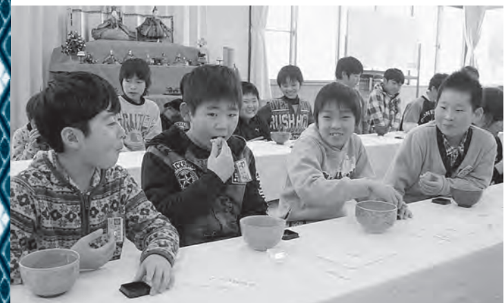
▲玉庭小では「和菓子学習会」でお茶と和菓子のいただき方について学んだ。4〜6年生全員のデザインした和菓子が具現化した、嬉しそうにほおぼる児童。「もったいなくて食べられない」といった声もあった。当日はどの和菓子が選ばれるのかも見どころの一つである。

でも、今年初の試みとして、藤田家で抹茶と共にふるまわれる和菓子や、4〜6年生がデザインするなど、町の菓子店の協力を得ながら進めてきました。 今後も、世代間で文化を引き継ぎながら「玉庭ひなめぐり」を続けていきたいです。