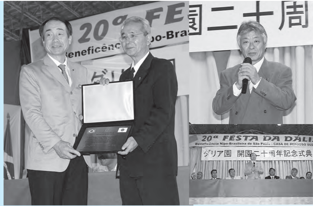
▲ダリア園開園20周年記念式典にて記念のプレートが授与された ▲ダリア園開園20周年記念式典