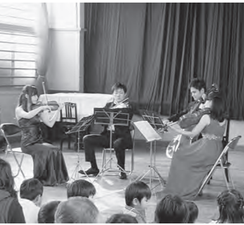
▲思い出の地で奏でる弦楽四重奏

2月22日、玉庭地区ふるさと総合センターおもいで館で「玉庭ふるさとコンサート」が開催されました。神奈川県川崎市市の音楽教室「芸術村あすなろ」を卒業した4人の若手演奏家が玉庭で演奏会を開くのは今回が初めて。「第二の故郷」と語る玉庭で心に響く弦楽四重奏を奏でました。また、福島県いわき市から30名ほどの親子連れが同コンサートやハハエロ、雪上レクリエーションなどに参加し、冬の玉庭を満喫しました。