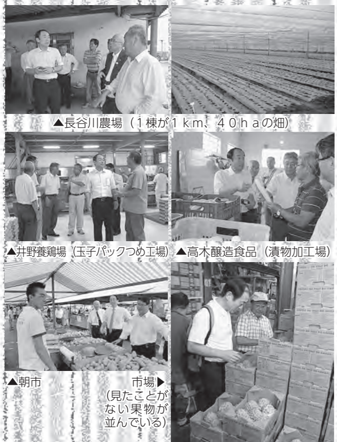
▲長谷川農場 (1棟が1km 2 、40haの畑)