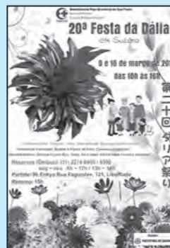
▲ダリア祭りポスター