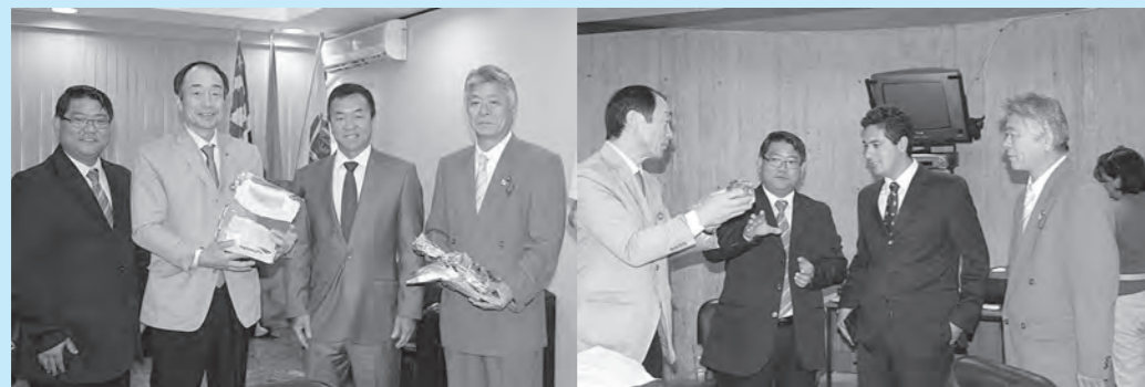
▲スザノ市長への表敬訪問