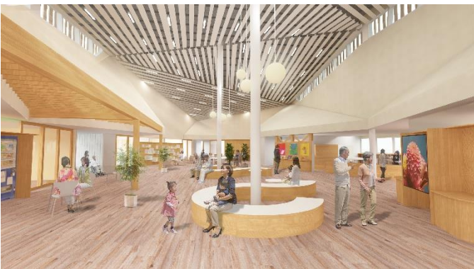
【ホワイエ（建物の中央）】

町では、昔の役場があった場所に「川西まちなかテラス」という施設を作る計画をしています。たくさんの人にこの場所を使ってもらい、町の中がにぎわうようにするためには、どんなことが必要か、また、どんなものがあると楽しく使えるか考えてみましょう。