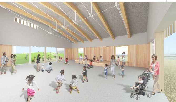
【ホール（建物の東側）】