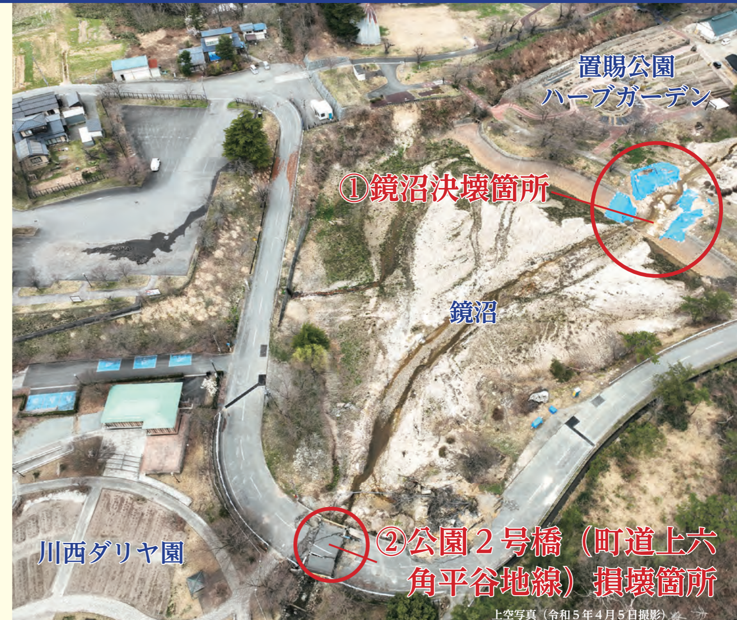
上空写真 (令和5年4月5日撮影)

本号では、甚大な被害を受けた場所の一つであり、復旧を進めている川西ダリヤ園付近の鏡沼や道路の状況をお知らせします。