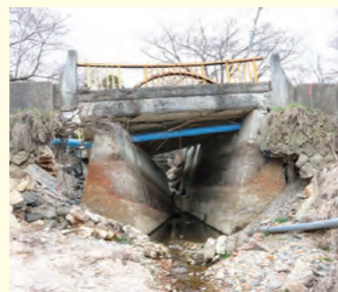
▲損壊した公園2号橋 (鏡沼の中から撮影)

箱の形をした地下に埋設されるコンクリート構造物。水路や横断通路をはじめ多くの工事で活用されています。