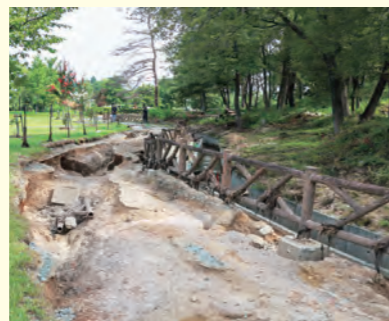
▲損壊した新八堤の下流水路 ※現在通路は復旧されています。

農業用ため池としての役割を維持するために、堤体の修繕など既存機能の復旧を行うとともに、今後同じような豪雨が発生しても今回のような決壊を起こさないために鏡沼の防災機能を強化します。そのために、鏡沼や新八堤の洪水吐(排水施設)や下流水路の拡幅を行うことで排水能力の向上を図ります。また、ため池の貯水量を監視するシステムの整備など、緊急時に早急に対応できるようにします。