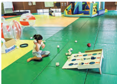
◀すくすく広場の様子

2年目は、より利用しやすい体育館になるように努力し、開催しているスポーツ教室も参加者の皆様と昨年よりさらに楽しめるように準備をします! 先日、地域の方と一緒にふきのとうを採りに行きました。天ぷらとふきのとう