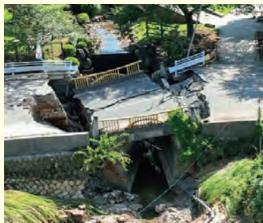
▲損壊した公園2号橋 (上空から撮影)