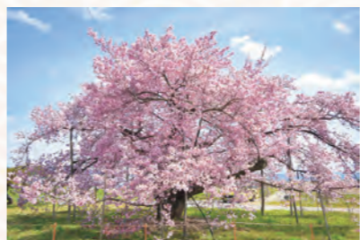
▲枝ぶりが立派な龍蔵桜

花の見ごろは今年15日前後になると予想されます。町教育文化課 ☎(44) 2843