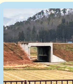
▲ボックスカルバート