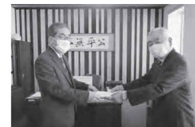
▲小松小学校学区再編検討委員会