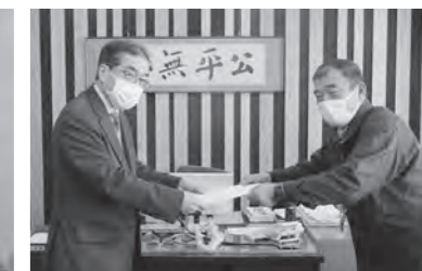
▲玉庭小学校学区再編検討委員会