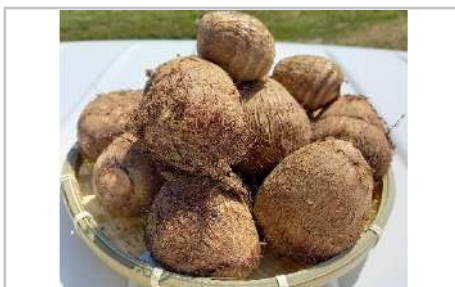
農家直送土付き里芋(大和早生)5kg

綺麗な地下水と雪解けの豊かな水源に恵まれた川西町で作られたつや姫です。美しく美味しいお米『つや姫』を是非ご賞味ください。【容量】つや姫5kg×2袋【発送期日】10月中旬以降