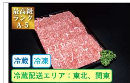
特選米沢牛A5・焼肉用500g

カタ肉をすき焼き用にスライスしご用意いたしました。赤身部位ながらも霜降りが適度に入るのが特徴です。深い味わいで老若男女問わずにお勧めいたします。【容量】すき焼き用500g