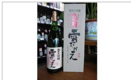
川西町の地酒純米大吟醸雪むかえ永楽