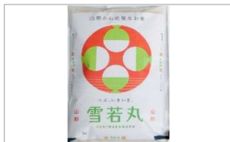
令和3年産川西町産米「雪若丸」精米真空パック詰5kg