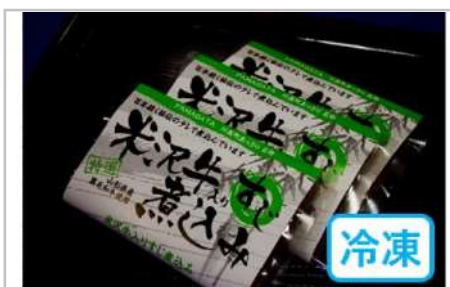
米沢牛すじ煮込み

厳選した山形県産格付け上豚の肩ロースに甘みが特徴の米麹味噌を使用。豚肉のおいしさを損なわずに味付けし、厳選唐辛子を使用した辛口をセットでご用意いたしました。【容量】豚肩ロース120g×3、米麹味噌40g×3（甘口、辛口の2種類）