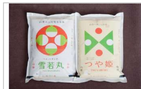
令和3年産川西町産米「雪若丸」「つや姫」精米セット真空パック詰5kg