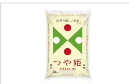
山形おきたま産つや姫10kg

赤身のモモ肉を薄くしゃぶしゃぶ用にスライスしご用意いたしました。【容量】しゃぶしゃぶ用500g