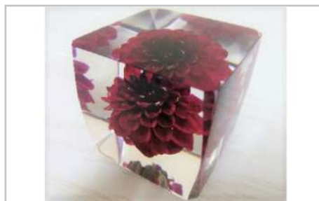
クリスタルダリヤ

綺麗な水の恩恵と独自の肥料の使用で土の持つ力を引き出し、植物にストレスをかけない栽培をして作ったお米です。是非ご賞味ください。【容量】雪若丸2kg×2袋【発送期日】10月中旬以降