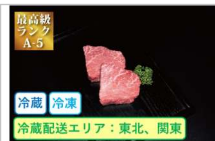
特選米沢牛A5・赤身ステーキ70g×2枚

煮込み用に適した赤身の部位を角切りにカットしをご用意いたしました。煮込めば柔らかく、格別の味をご堪能ください。【容量】カレー・シチュー用400g