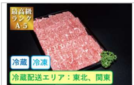
特選米沢牛A5・焼肉用210g

カタ肉をすき焼き用にスライスしご用意いたしました。赤身部位ながらも霜降りが適度に入るのが特徴です。深い味わいで老若男女問わずにお薦めいたします。【容量】すき焼き用240g