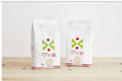
令和3年産特別栽培米つや姫4kg