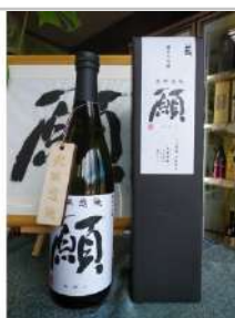
「衆病悉除願（ねがい）」

綺麗な地下水と雪解けの豊かな水源に恵まれた川西町で作られたつや姫です。美しく美味しいお米『つや姫』を是非ご賞味ください。【容量】つや姫5kg×1袋【発送期日】10月中旬以降