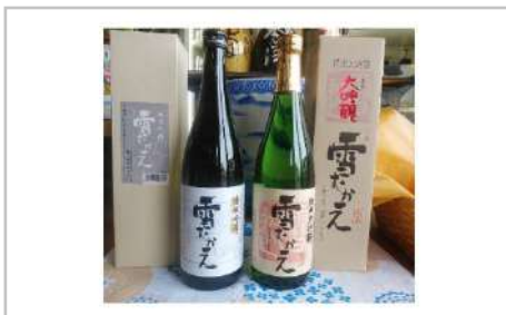
純米大吟醸雪むかえ永楽と純米吟醸雪むかえの飲み比べセット

「雪むかえ永楽」はしっかりした旨味のある辛口のお酒です。冷やして、常温で、人肌爛で、お好みの温度でお楽しみいただけます。お酒の好きな方におすすめです!【容量】純米大吟醸雪むかえ永楽1800ml×1本