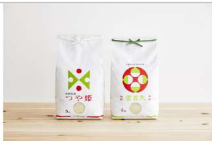
令和3年産つや姫・雪若丸計10kg