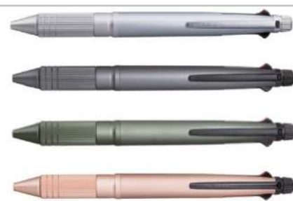
ジェットストリーム多機能ペン4&amp;1MetalEdition0.5mm

旨味のある濃厚な辛口の美味しいお酒です。コロナウィルスの終息を願い神社で祈願しました。人々の病をことごとく除くという意味の「衆病悉除（しゅびょうしつじょ）」木札付きです！【容量】純米大吟醸「願」720ml×1本