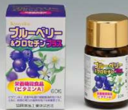
Kyoyakuブルーベリー&amp;クロセチンプラス

イチヨウ葉エキスにナットウキナーゼをプラスした健康補助食品です。ナットウキナーゼは無臭タイプで、ビタミンKやプリン体を除去したものを使用しています。【容量】イチヨウ葉エキス食品30g(250mg×120粒)