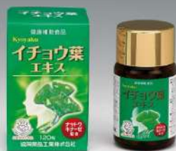
Kyoyakuイチヨウ葉エキス

綺麗な地下水と雪解けの豊かな水源に恵まれた川西町で作られたつや姫です。美しく美味しいお米『つや姫』を是非ご賞味ください。【容量】特別栽培米つや姫玄米5kg×2袋【発送期日】10月中旬以降