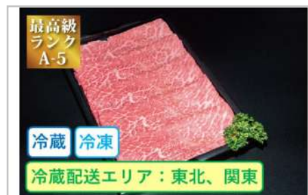
特選米沢牛A5・しゃぶしゃぶ用210g

深い味わいの部位を選び、網焼き用の厚みにカットしご用意いたしました。牛肉本来の濃厚な味をご堪能ください。【容量】焼肉用210g