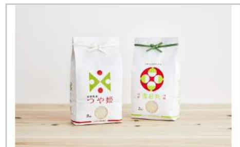
令和3年産つや姫・雪若丸セット計4kg

ダリア生花を特殊な技術で加工し、その色合いや華やかさをアクリル樹脂に封じ込めました。※ハンドメイドの為、サイズは多少の誤差が生じることもあります。【容量】クリスタルダリヤ四角型極小11個(幅4cm×奥行4cm×高さ4cm)