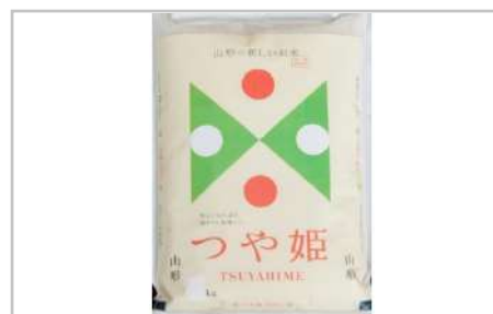
令和3年産川西町産米「つや姫」精米真空パック詰5kg

砂糖と醤油を継ぎ足し100年間受け継がれてきた秘伝のタレで煮込まれた逸品です。【容量】米沢牛すじ煮込み160g×3パック