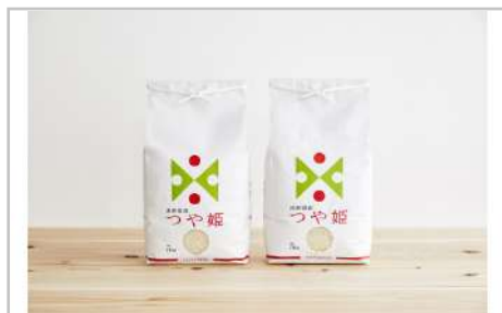
令和3年産特別栽培米つや姫10kg(5kg×2袋)

綺麗な地下水と雪解けの豊かな水源に恵まれた川西町で作られたつや姫です。美しく美味しいお米『つや姫』を是非ご賞味ください。【容量】つや姫10kg×1袋【発送期日】10月中旬以降