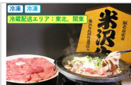
特選米沢牛A5・すき焼き用500g

カタ肉をすき焼き用にスライスしご用意いたしました。赤身部位ながらも霜降りが適度に入るのが特徴です。深い味わいで老若男女問わずにお勧めいたします。【容量】すき焼き用500g