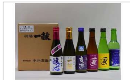
羽陽一献300ml 6種類飲み比べセット

コクのあるしっかりとした味わいの純米大吟醸「雪むかえ永楽」と、さわやかなキレのある味わいの純米吟醸「雪むかえ」です。【容量】・純米大吟醸「雪むかえ永楽」720ml×1・純米吟醸「雪むかえ」720ml×1