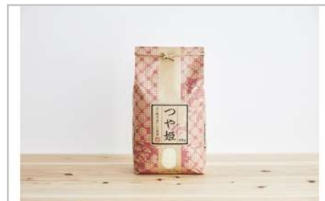
令和3年産特別栽培米つや姫10kg

黒酢は鹿児島県伝統の「つぼ酢」の濃縮末、にんにくは無臭タイプ、卵黄油はレシチンを多く含むものを使用しています。【容量】にんにく含有食品36g(300mg×120粒)