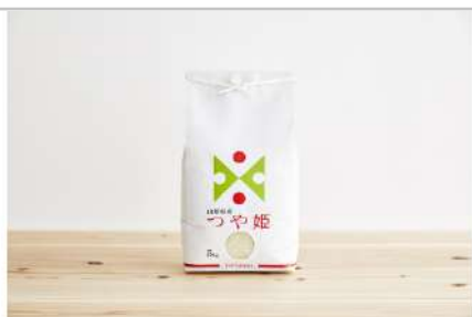
令和3年産特別栽培米つや姫5kg

歴史ある酒蔵「樽平酒造」の日本酒を菰樽に入れた特別純米酒です。麴の風味が際立った日本酒本来の力強さが特徴です。飲み終わった後はきれいに洗ってインテリアとしてもお楽しみいただけます。【容量】樽平酒造「菰樽樽平」300ml×1