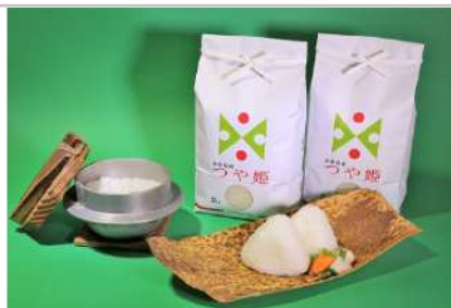
令和3年産特別栽培米つや姫4kg

綺麗な地下水と雪解けの豊かな水源に恵まれた川西町で作られたつや姫。美しく美味しいお米『つや姫』を是非ご賞味ください。【容量】つや姫2kg×2袋【発送期日】10月中旬以降