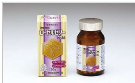
KyoYakuローヤルゼリープラス