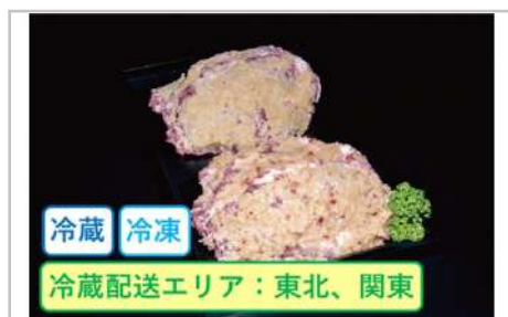
豚の米麹味噌漬け甘口3枚辛口3枚セット

赤身のモモ肉を薄くしゃぶしゃぶ用にスライスしご用意いたしました。【容量】しゃぶしゃぶ用210g