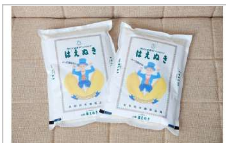
令和3年産川西町産米「はえぬき」精米真空パック詰6kg