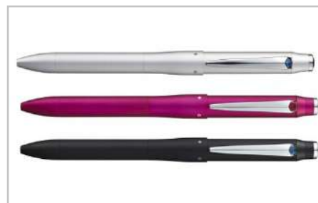
ジェットストリームプライム多機能ペン0.7mm

塩の辛味と砂糖の甘味が、一粒撰りの大納言にとけ込みます。こだわりの味をご賞味くださいませ。【容量】・塩小倉300g・梅羊かん300g・栗羊かん300g・いいよかん300g・ひと口塩小倉5本・くみゆべし5個入×2袋