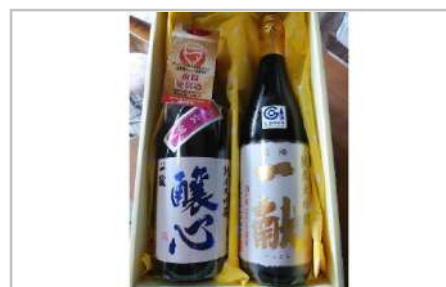
純米大吟醸「醸心」純米大吟醸「酒の華一献」セット

「ほどよい粘りと弾力性」「香りと甘みがつよく濃い味わい」「粒揃いが良く光沢と白度が高い」これらを兼ね備えたつや姫です。【容量】山形おきたま産つや姫5kg袋×2