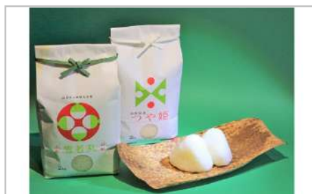
令和3年産つや姫・雪若丸計4kg

綺麗な水の恩恵と独自の肥料の使用で土の持つ力を引き出し、植物にストレスをかけない栽培で作ったお米です。是非ご賞味ください。【容量】雪若丸5kg×1袋【発送期日】10月中旬以降