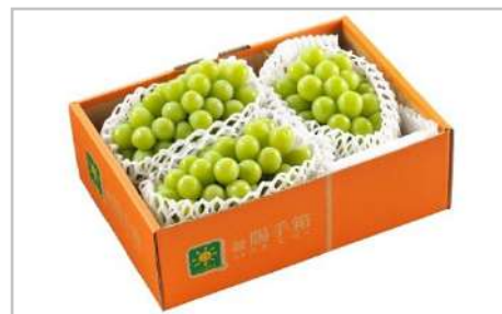
シャインマスカット(秀)2~3房(1.7kg)

緑豊かなここ川西町の粘土質の土壌で育ったクリミーで上品な食味のうえに程よいねっとり感!お届けする里芋のサイズは小~大までのミックスでお送りします。【容量】・里芋5kg【受付期間】7/9~12/31【発送期日】10/25から順次発送