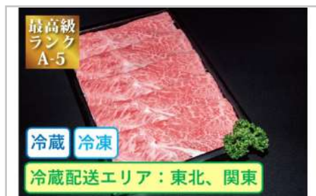
特選米沢牛A5・すき焼き用240g