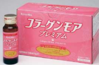
Kyoyakuコラーゲンモアプレミアム

目に大切なブルーベリー(北欧産ビルベリー)エキスとクロセチンを配合しました。カシスエキス、ルテイン、アスタキサンチン、ビタミンB12、ビタミンEもプラスしました。【容量】ブルーベリー・クロセチン含有食品18g(300mg)×60粒