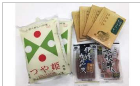
つや姫と米沢牛ビーフカレーとおつまみセット

酒米「雪女神」と「酒の華」を100%使用したお酒は、とても華やかな香りが特徴で、しっかりとのお米の旨味が感じられる美味しいおすすめのお酒です。【容量】・純米大吟醸「醸心」720ml×1・純米大吟醸「酒の華一献」720ml×1