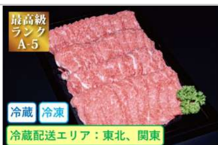
特選米沢牛A5・切り落とし400g

4色(黒赤青緑)ボールペンとシャープペンシルの多機能ペンです。アイスシルバー、ガンメタリック、ダークグリーン、ピンクゴールドよりお選びください。【容量】ジェットストリーム多機能ペン4&1MetalEdition0.5mm×1本