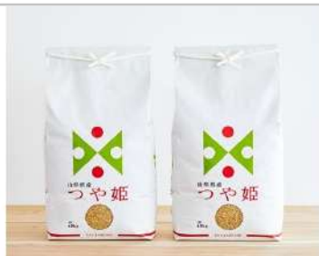
令和3年産特別栽培米つや姫玄米10kg

山形県産米出羽の里を使用した山廃仕込みのお酒です。季節の移り変わりをイメージして造られており、冷・常温・お燗まで色々な温度で楽しめます！【容量】中沖酒造純米吟醸ダリアリミテッド720ml×2本【受付期間】9/13~11/5