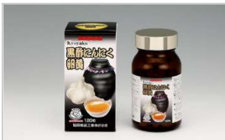
KyoYaku黒酢にんにく卵黄

1日4粒でローヤルゼリー(生換算)を2,000mg、大豆イソフラボン(アグリコン換算)を16mg、レスベラトロールを4mg摂取できる健康補助食品です。【容量】ローヤルゼリー含有食品60g(500mg×120粒)