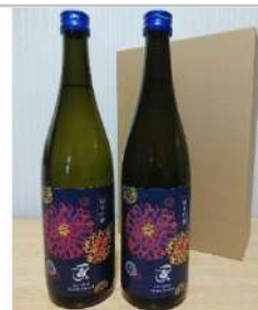
純米吟醸ダリアリミテッド2本セット

吸収性にこだわった「水溶性コエンザイムQ10」を使用しています。エネルギー産生サポート成分であるローズヒップエキス、α-リポ酸、L-カルニチンをプラスしました。【容量】コエンザイムQ10含有食品27g(270mg×100粒)