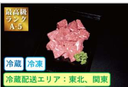
特選米沢牛A5・カレー、シチュー用400g

最高格付けA-5より厳選した米沢牛の切り落としをご用意いたしました。深い旨味で煮ても焼いても普段の料理が格別な味わいになります。【容量】切り落とし400g