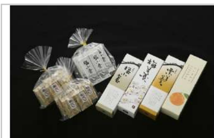
こだわり羊かんとゆべしの詰合せ

自慢のつや姫、米沢牛入りカレー、サラミとカルパスのセットです。【容量】・山形産特別栽培米つや姫2kg×2袋・米沢牛ビーフカレー200g×4箱・米沢牛入りさらみ170g×1袋・伊達カルパス130g×1袋