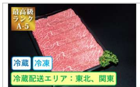
特選米沢牛A5・しゃぶしゃぶ用500g

深い味わいの部位を選び、網焼き用の厚みにカットしご用意いたしました。牛肉本来の濃厚な味をご堪能ください。【容量】焼肉用500g