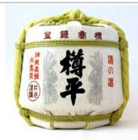
樽平酒造 菰樽詰め「樽平」

綺麗な地下水と雪解けの豊かな水源に恵まれた川西町で作られたつや姫です。美しく美味しいお米『つや姫』を是非ご賞味ください。【容量】つや姫2kg×2袋【発送期日】10月中旬以降