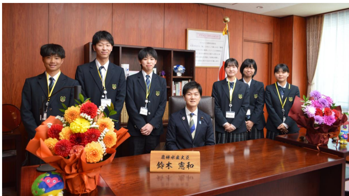
県立置賜農業高等学校の生徒による鈴木憲和農林水産大臣訪問